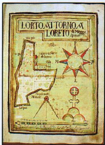
Platea dei possedimenti di Montevergine

La Biblioteca di Montevergine partecipa infine al fitto calendario di eventi organizzati sia dal Comune di Mercogliano (nel cui territorio ricade il palazzo abbaziale di Loreto), sia dal Ministero per i Beni e le Attività Culturali; qui si citerà soltanto il “Maggio dei Monumenti”, oppure le “Giornate europee del patrimonio”, o ancora “Ottobre piovono libri”.