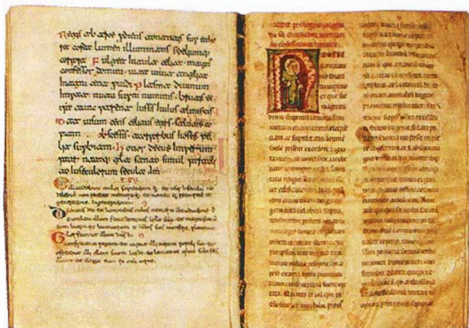
Codice 1, Legenda della vita di San Guglielmo