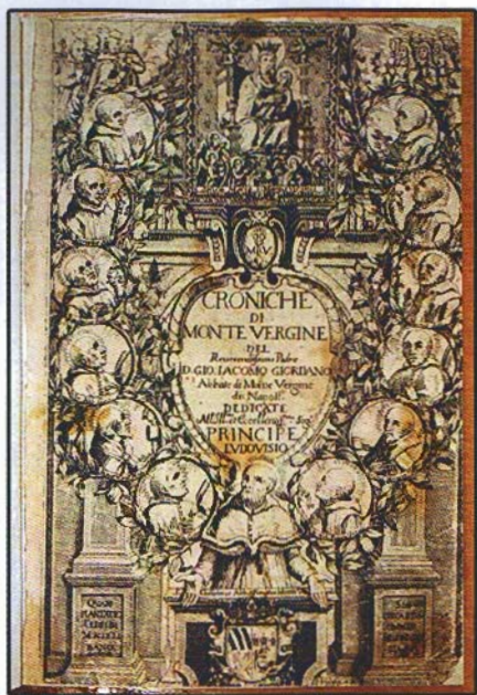
Frontespizio inciso dalle Croniche di Montevergine , di G. G. Giordano, 1649

La Biblioteca di Montevergine ospita due mostre permanenti, ma cura un'attività espositiva pressoché ininterrotta, con in media una mostra all'anno. Produce il «Bollettino delle nuove accessioni», che dal 2006 viene pubblicato soltanto on line sul sito web della Biblioteca. Pur essendo per sua natura di conservazione, la Biblioteca di Montevergine ha saputo