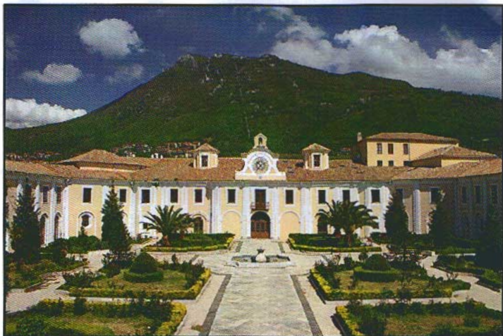
Particolare del chiostro del Palazzo abbaziale di Loreto di Mercogliano

In prima pagina: Montevergine in un'incisione del 1703