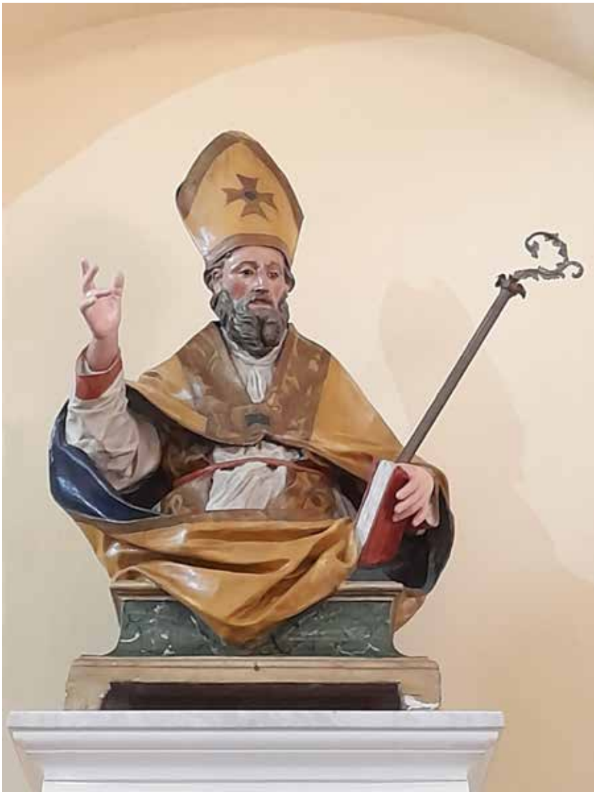
Fig. 8. Tranzi, chiesa parrocchiale di S. Vitaliano, S. Vitaliano vescovo , sec. XVIII, bottega napoletana, cartapesta.