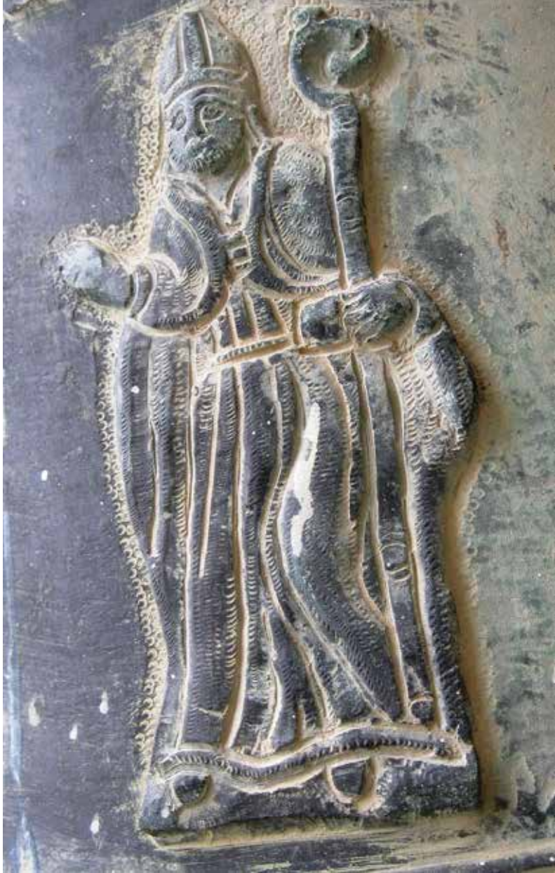
Fig. 4. San Vitaliano, chiesa parrocchiale di Maria Ss. della Libera, cella campanaria, campana mediana, 1716, effigie di s. Vitaliano vescovo.