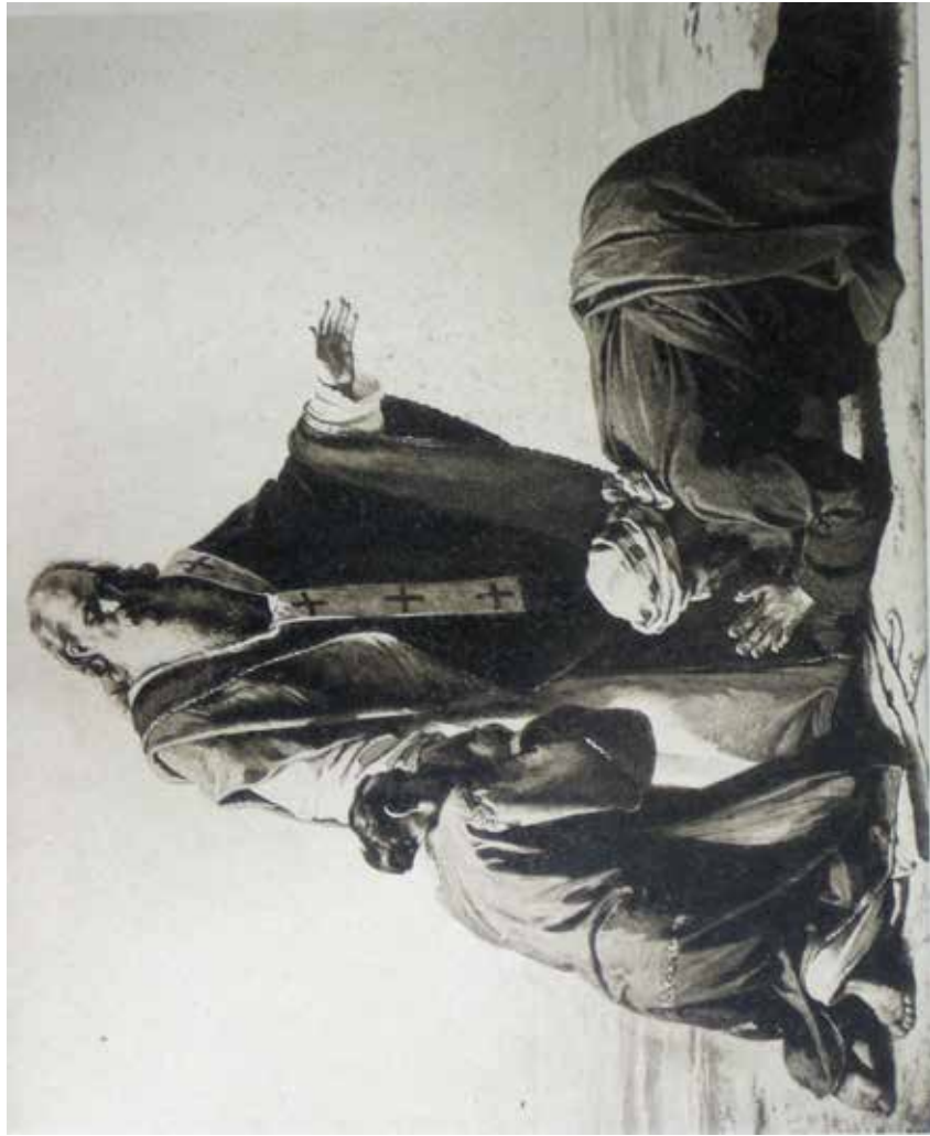
Fig. 13. Già Capua, cattedrale di Maria Ss. Assunta in Cielo e S. Bellarmino, navata maggiore, parete sinistra (a destra del lato del Vangelo), ottava tela, G. MANCINELLI, S. Vitale vescovo di Capua , 1863, olio su tela, andata distrutta nel 1943.