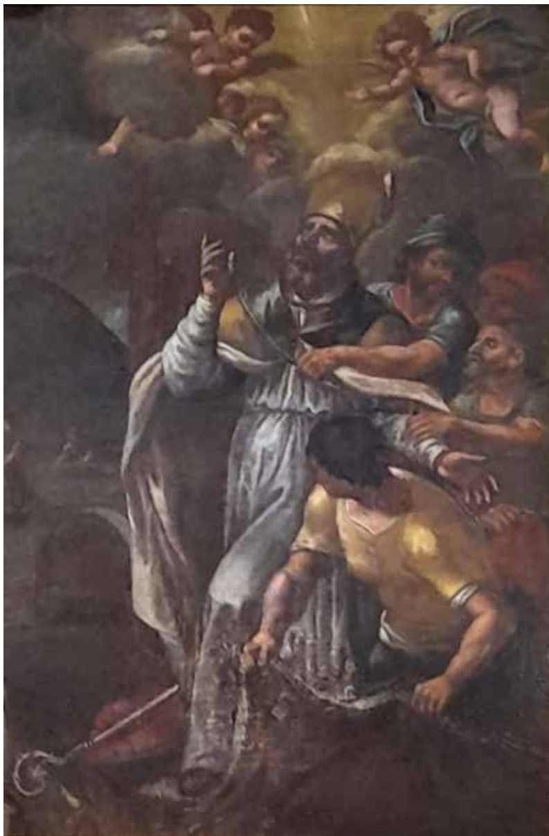
Fig. 7. Tranzi, chiesa parrocchiale di S. Vitaliano, altare maggiore, S. Vitaliano , sec. XVIII, Ignoto, olio su tela, scena principale.