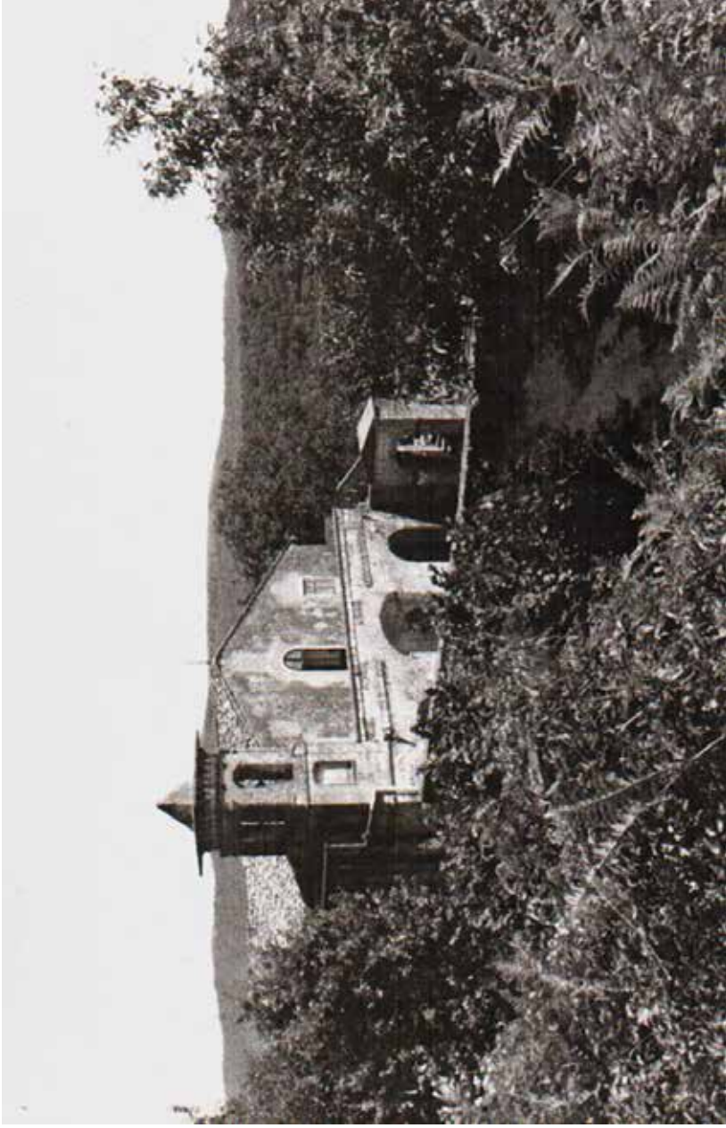
Fig. 2. Càsola (fraz. di Caserta), eremo di S. Vitaliano, ante 1627.