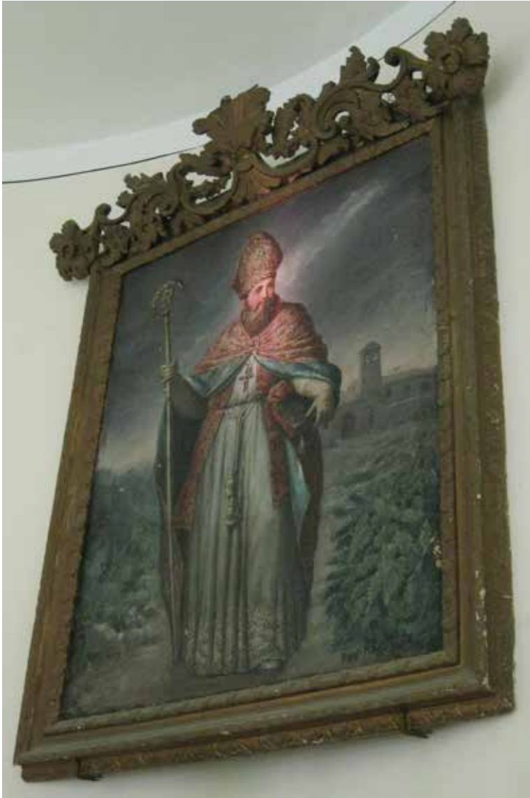
Fig. 16. Sparanise, chiesa sussidiaria di S. Vitaliano, altare, G. RAGOZZINO, pala del patrono, ante 1938, olio su tela.