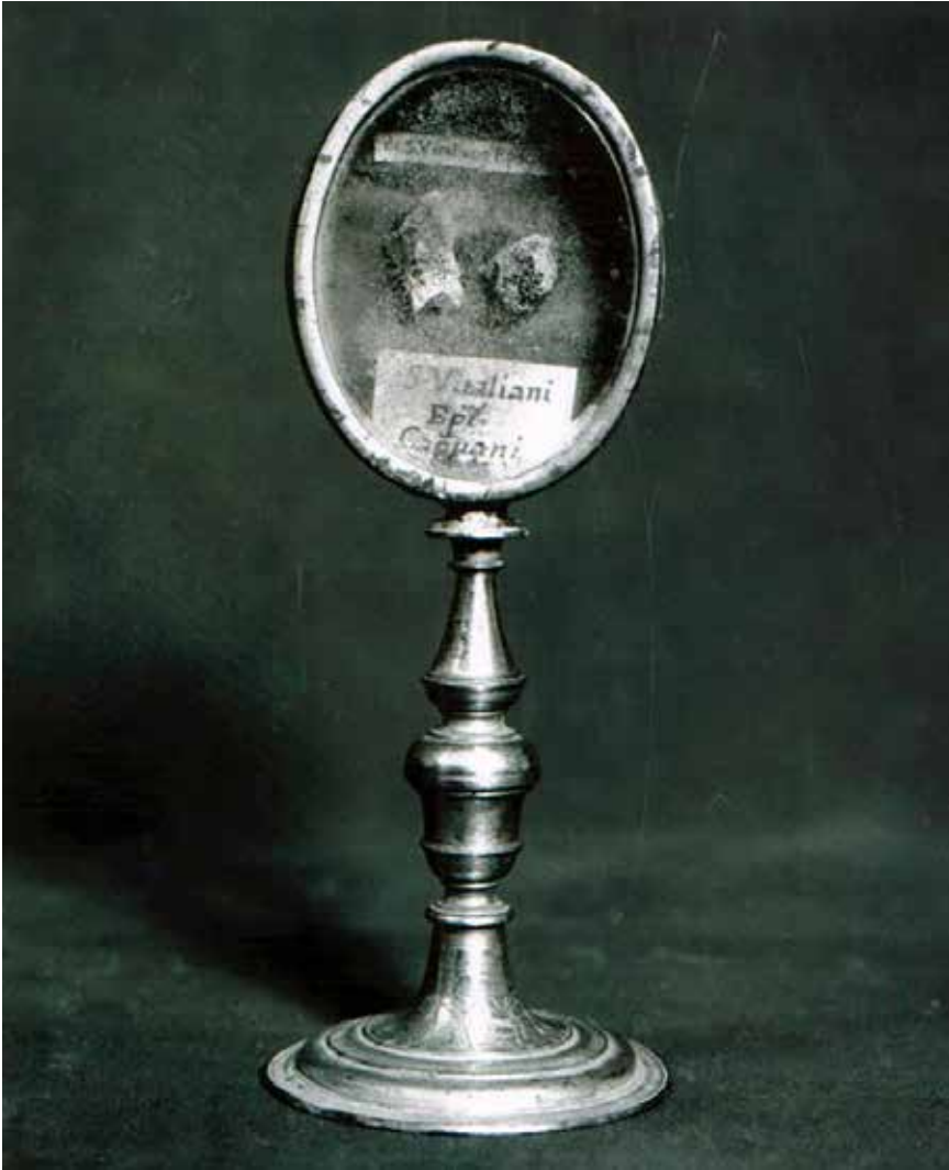
Fig. 3. Già Capua, cattedrale di Maria Ss. Assunta in Cielo e S. Bellarmino, armadio delle reliquie, reliquiario di s. Vitaliano vescovo di Capua, sec. XVIII in. , orafi napoletani, rame dorato e metallo argentato, irreperibile.