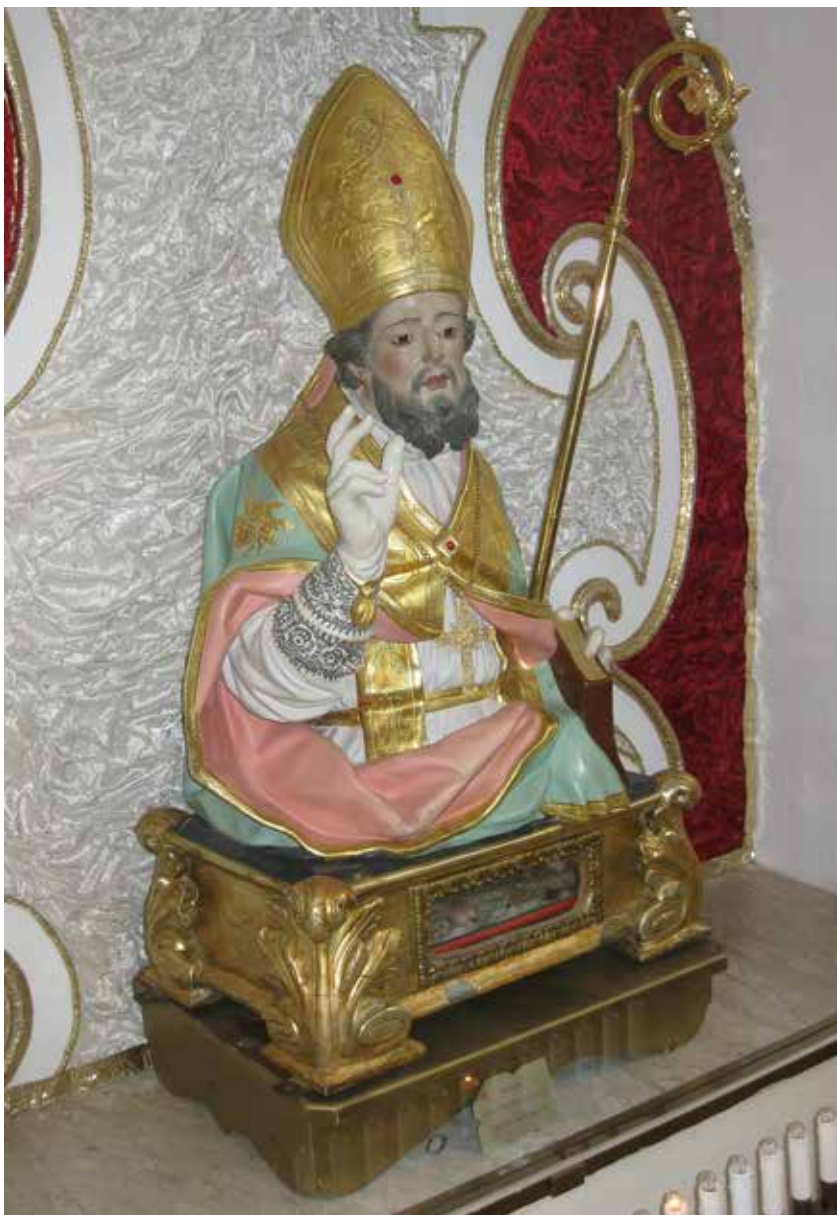
Fig. 10. Sparanise, chiesa matrice dell'Annunziata, busto reliquiario di s. Vitaliano vescovo, sec. XVIII ex. , restaurato nel 1978, legno.