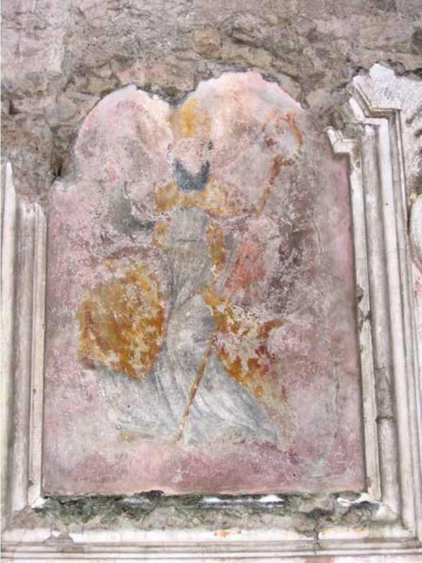
Fig. 14. San Vitaliano, chiesa parrocchiale di Maria Ss. della Libera, parete esterna, lato sud, S. Vitaliano vescovo , sec. XIX-XX, maestranze locali, dipinto a fresco, rimaneggiato.