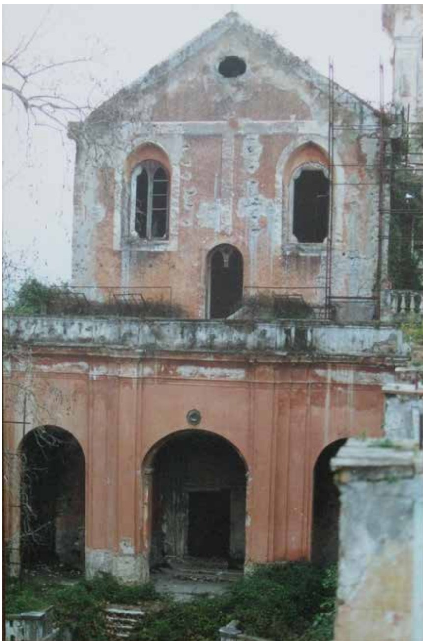
Fig. 6. Casamarciano, complesso di S. Maria del Plesco, primo quarto del sec. XVIII.