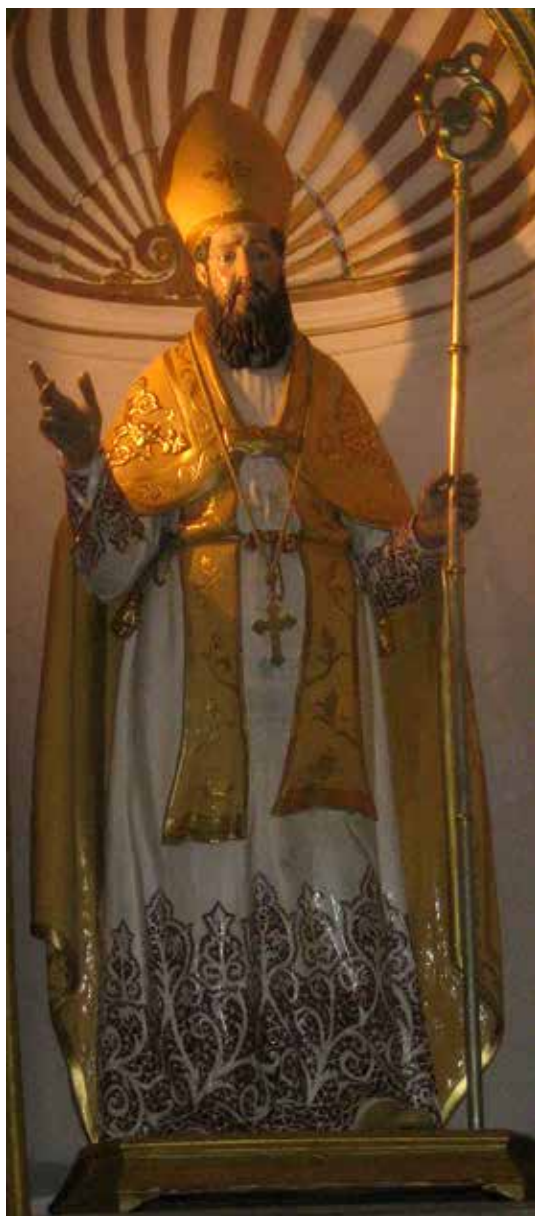
Fig. 11. San Vitaliano, chiesa parrocchiale di Maria Ss. della Libera, altare maggiore, S. Vitaliano vescovo , sec. XIX, prima metà, maestranze napoletane, legno.