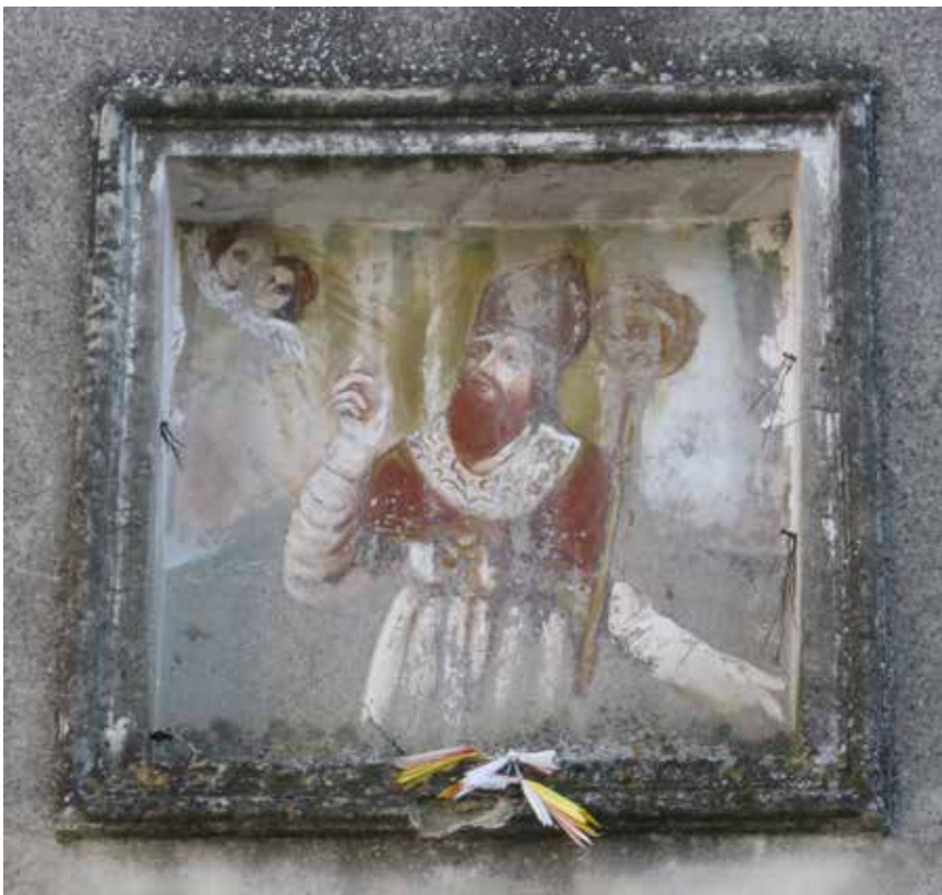
Fig. 15. Tranzi, chiesa parrocchiale di S. Vitaliano, frontone, sec. XIX-XX, maestranze locali, dipinto a fresco, rimaneggiato.