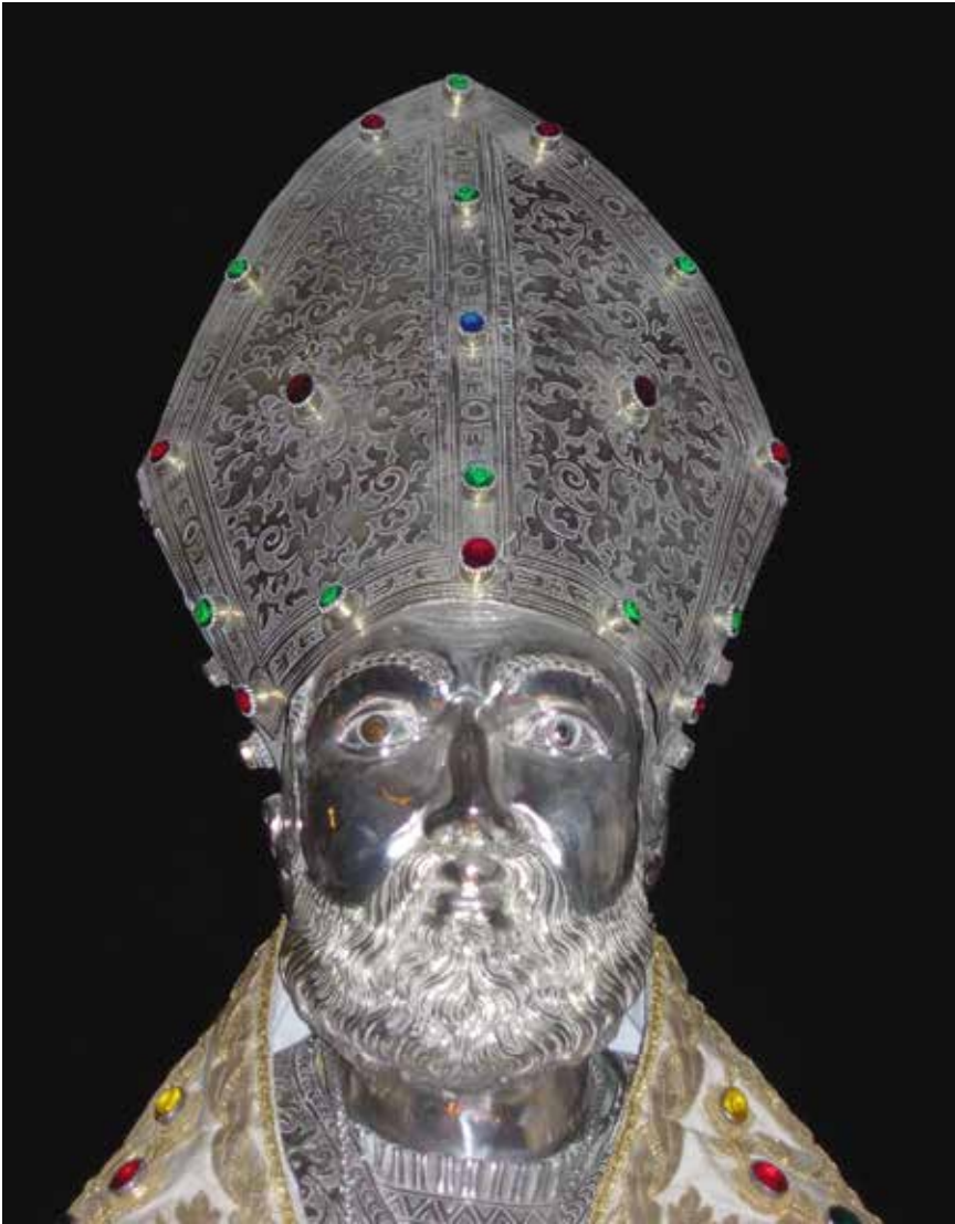
Fig. 1. Catanzaro, cattedrale di S. Maria Assunta e dei SS. Apostoli Pietro e Paolo, cappella di S. Vitaliano, busto reliquiario di s. Vitaliano, sec. XVI ex., orafi napoletani, argento, particolare.